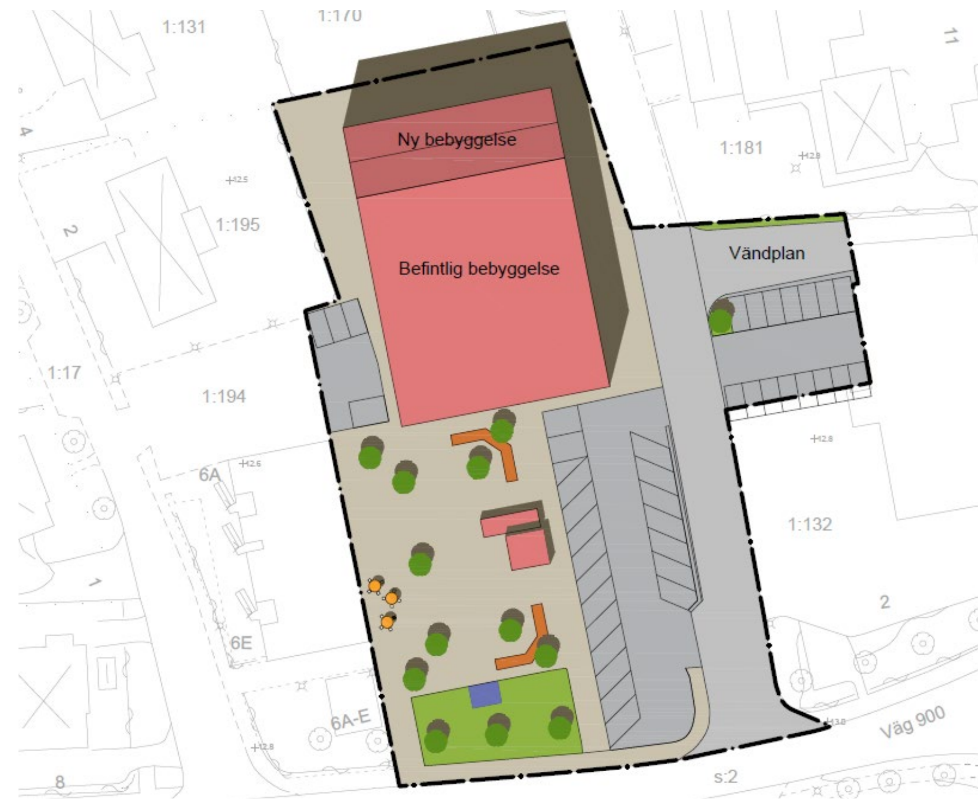
Illustration över planområdet.

Under vecka 31 och 32 kan frågor endast besvaras via mejl på grund av semester.